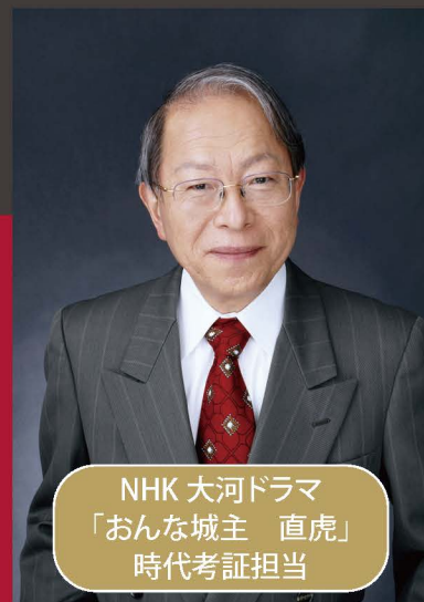
NHK 大河ドラマ 「おんな城主 直虎」 時代考証担当

桶狭間の戦いに関しては、研究が進んだにもかかわらず、いまだ、いくつもの謎があります。 基調講演では、①今川義元の尾張侵攻のねらいは何か ②義元の昼食休憩場所桶狭間山はどこか ③織田信長はどのルートを進んだのか ④桶狭間古戦場が2カ所あるのはどうしてか ⑤桶狭間の戦いの歴史的意味は何だったのか という5つにしばり、最新研究も紹介しつつ、謎解きに挑戦します。